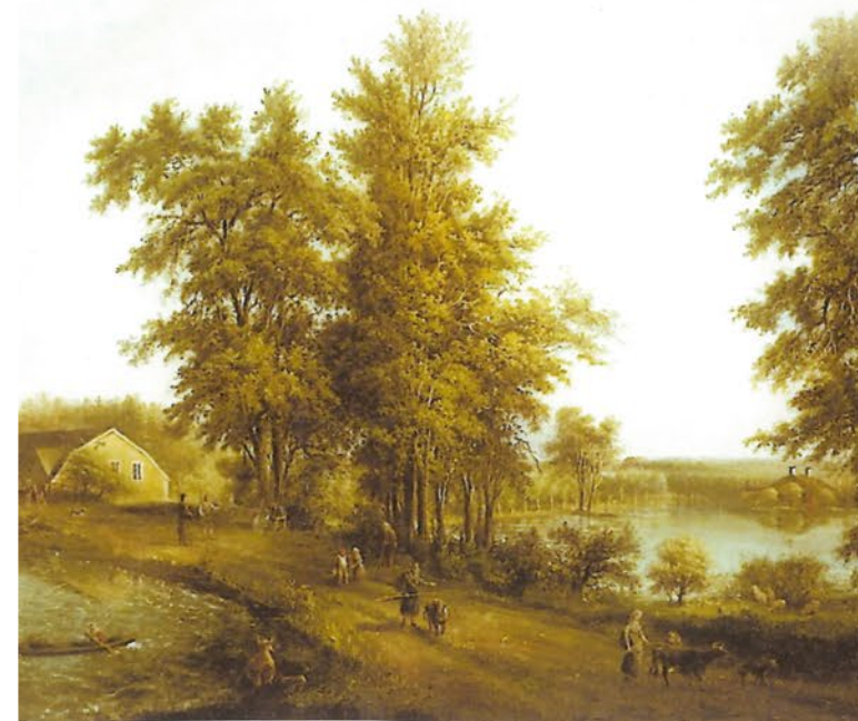
Målning vid Stordammen av Elias Martin, sekelskiftet 17-1800