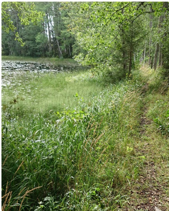
Stig på dammlagg från 1600-talet. Harvikadammen