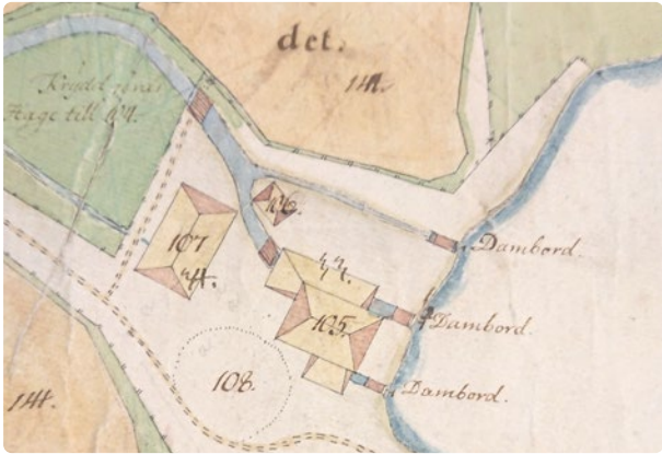
Oppdammens hammare, labby och kolhus 1764.