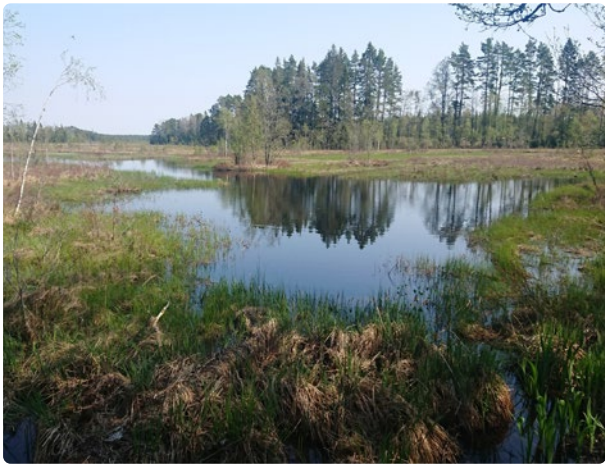
Halldammen intill Kulturstigen